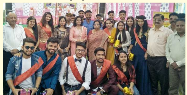
Winners of Ms. & Mr. Freshers

The students enjoyed the dance performances, melodious songs and stand up comedy which was performed by the senior students for the fresher. It was memorable and mesmerising day for all the students.