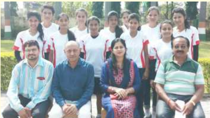
Women Volleyball Team with Coach and Faculty Members

SC Guria IMT participated in Kumaun University Inter Collegiate Volleyball (Women) Tournament 2018 organized by Chandrawati Tiwari Girls Degree College, Kashipur from 13-14 October, 2018. Our players displayed their skills and enthusiasm and reached the quarter final.