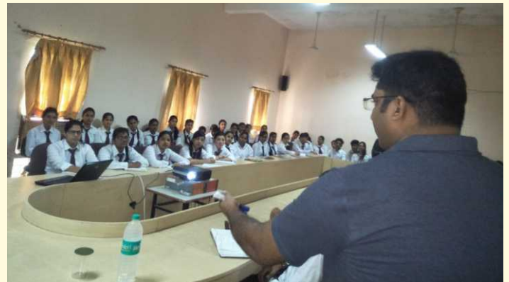
Expert Interacting with the Students