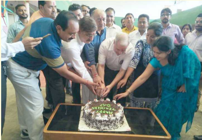
Cake Cutting Ceremony at Teacher's Day

The teacher's day was celebrated with full zest and zeal at SCG IMT on 5 September, 2018. All the students and staff remembered the person behind this celebration – Dr. S. Radhakrishnan. The function started with various cultural activities by the students followed by Cake Cutting Ceremony. A lunch party was also organized for all the faculty and staff members by the students. Over all, the event was a great success.