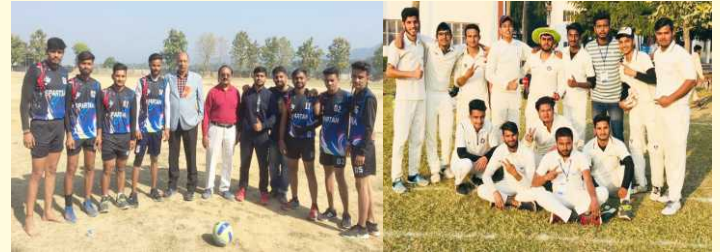
Winner Volleyball Team

Cricket - Runner-up with cash prize Rs. 7000.