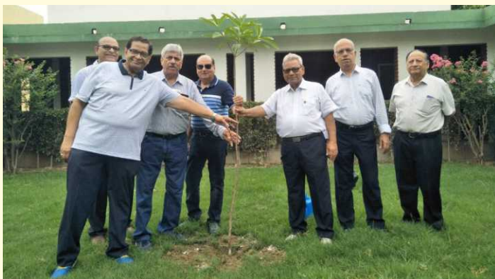
Plantation at SCG IMT Campus by Rotarians

Tree plantation 'Haritima' was the another activity organized by our institute through Rotary Club of Kashipur Corbett and Rotract Club of SCG IMT on 1 July, 2018. We arranged variety of plants and these were planted parallel to boundary wall areas and lawns of SCG IMT campus. On this occasion newly formed committee members of Rotary Club Kashipur Corbett; directors, deans, faculty and staff members of SCG IMT were present. As a matter of fact plantation was done by the institute in the previous year also.