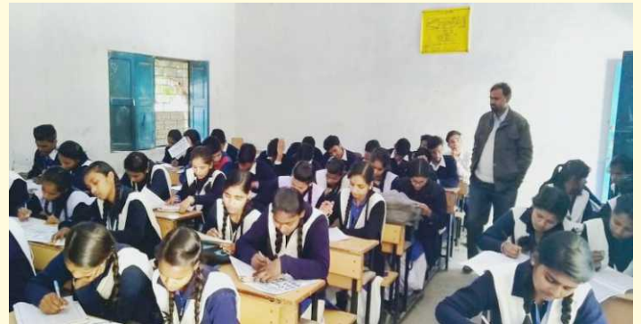
GK Exam conducted by SCG IMT