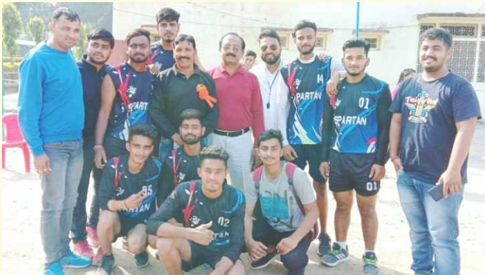
Volleyball Players at Ramnagar

SC Guria IMT participated in Kumaun University Inter Collegiate Volleyball (Men) Tournament 2018 organized by P.N.G. Govt. (P.G.) College, Ramnagar, Nainital from 16-17 November, 2018. Our players displayed their sporting spirit and reached the semi final.