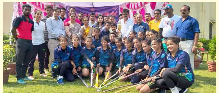
Winner Team with Trophy