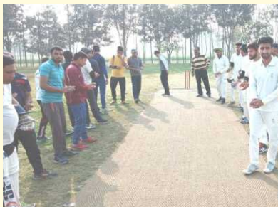
Players of SRF & SCG IMT