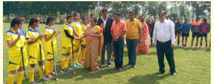
Chief Guest & Guest of Honour interacting with the players

Women hockey teams of various degree colleges of Kumaun University, Nainital participated in two days tournament. Final match was played between Tanakpur and Pithoragarh team. Tanakpur team won the match by 2-0. Various dignitaries were present during the programme.