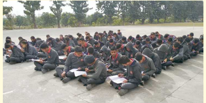
GK Exam conducted by SCG IMT