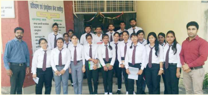
Industrial Visit at NSIC, Kashipur

As a part of curriculum, the students are required to undertake industrial visits to a few industries of repute so as to provide them with the real insight of working procedure of corporate world, an industrial visit was organized to National Small Industry Corporation (NSIC), Kashipur for the students of MBA & BBA course on 4 October, 2018.